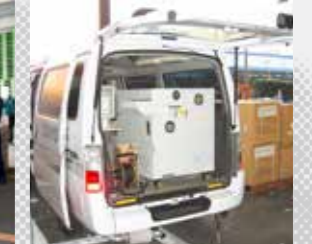
不正薬物・爆発物探知装置(TDS)による検査