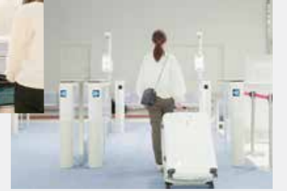
税関検査場電子申告ゲート