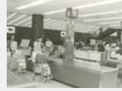
成田税関支署 旅具検査場(昭和53年)