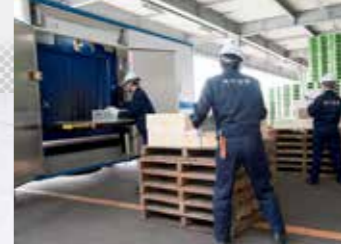
移動式X線検査装置による検査