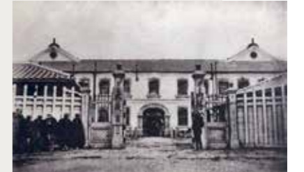
東京・大手町に所在した大蔵省庁舎「明治大正建築写真集覧」

これにより大蔵省(当時)でも機構改正が行われ、租税、関税、検査などの局が設けられました。税関は関税局の所管となり、関税局内には議案、統計などの掛が設置されました。