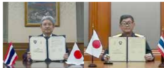
日タイAEO相互承認署名(2022年4月)