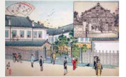
東京名所 大蔵省及び貴族院之図 (明治29年、楓斎画)