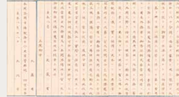
各開港場における輸出入税や運上所に係る事務を大蔵省へ移管することとなった開港開市場税務管轄中立(明治4年8月28日)

明治新政府のもと、当初は、運上所の外交的な役割に着目して、外務省の管轄下に置かれていましたが、外国貿易が次第に発展していくにつれて、国の徴税機関としての役割が着目されるようになり、明治4年8月(1871年)、運上所は、財政当局である大蔵省租税寮(当時)に所管が移されました。