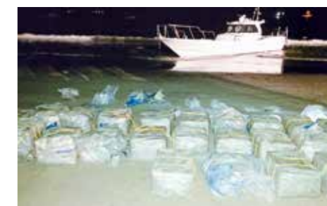
令和元(2019)年6月、伊豆諸島鳥島南西方沖で洋上取引(瀬取り)された覚醒剤約1トンが摘発