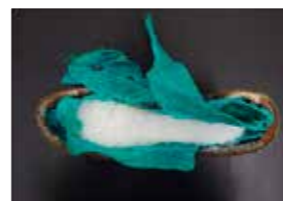
サンダルの底内部