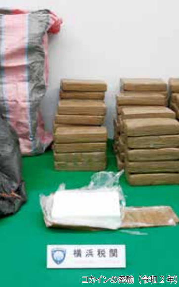
コカインの密輸(令和2年)