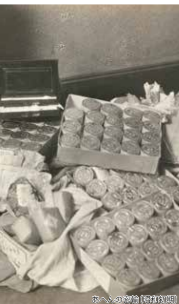
あへの密輸(昭和初期)

リクルートする方法はいくつかのパターンがありますが、ここで、特徴的な2つの手法について紹介します。1つ目は、ラブコネクション(通称ラブコネ)と呼ばれる恋愛感情を逆手に取った手法で、これは親密になった海外の異性(密輸組織の者)から「この荷物を日本にいる私の知人に届けて欲しい」、「日本にいる私の親戚への荷物を送るので、代わりに受け取って欲しい。後で親戚が取りに行く」などと、言葉巧みに依頼され、運搬役や受取役として、密輸入に加担してしまうケースです。2つ目は、見知らぬ人物からの、メールやSNSによる仕事の依頼などを通じて、密輸入に加担してしまうケースです。仕事の依頼と称して連絡してきた人物とメールでやり取りをする中で、荷物を受け取るよう頼まれ、安易に引き受けてしまった結果、知らないうちに不正薬物の受取役となっていたケースなどがあります。