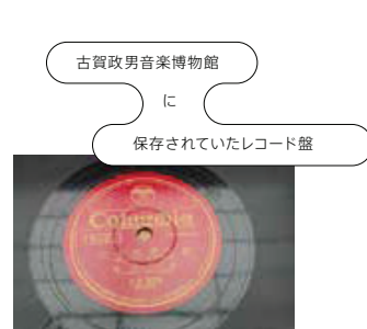
古賀政男音楽博物館 に 保存されていたレコード盤