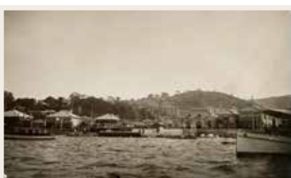
大正初期の写真。旧派出所は写真右側。