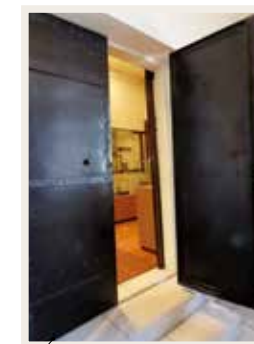
高関税品などを一時的に保管していた部屋(鉄製扉で仕切られている)

長崎は、はるか昔から外国へ門戸を開き、異国情緒あふれる港町へと姿を変えていき、税関も同様に、ヒトやモノの流れの変化に対応し、密輸取締りや迅速通関などの使命を果たしてきました。また長崎は日本有数の観光都市へと飛躍していき、旧派出所の目の前にある松ヶ枝埠頭にはCIQ施設を備える国際旅客ターミナルが完成し、インバウンド需要にも対応してきました。長い税関の歴史の一つのピースとして、今も長崎港を見守っている旧長崎税関下り松派出所。長崎税関は、これからも長崎の街とともに、古より受け継がれている使命を胸に、歴史豊かな長崎を水際で守っていききたいと思います。