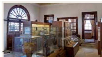
当時検査場だった建物の内部