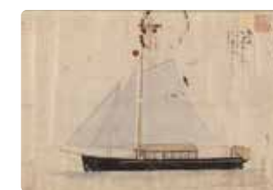
長崎奉行用船(長崎歴史文化博物館蔵)

長崎奉行所は、長崎奉行用船を使用してオランダ船や中国船の入港尋問や積荷の確認、そして抜け荷の取締りを行っていました。監視艇を利用した外国貿易船等に対する取締りは、現在でも脈々と受け継がれています。