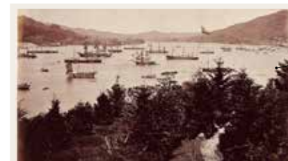
明治初期、グラバーの旧邸宅付近から長崎港を撮影。