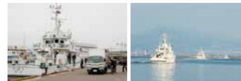
「つばさ」からトラックに支援物資を積み替えている様子 物資輸送のため函館港から大湊港へ向け出港する監視艇 3 艇

平成 23 (2011) 年 5 月 30 日、関税局は、被災地域における貿易・物流の円滑化・活性化による復興を推進し、社会経済の再生と国民生活の再建を図るため、これまでの措置に新たな支援策を追加した「東日本大震災からの復興に係る税関の支援策」を発表しました。 この支援策は、1. 被災地域の貿易活性化、2. 被災地域に所在する輸出入者等の事務負担の軽減、3. 被災地域における税関手続の弾力的対応の継続、4. 被災地域における申告・納付等の期限の延長等の 4 項目で構成されています。