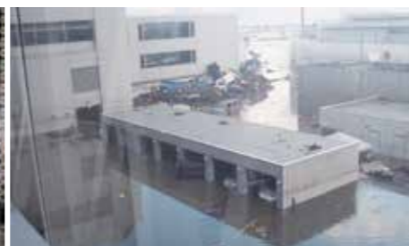
仙台空港税関支署駐車場