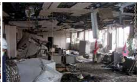
石巻出張所事務室