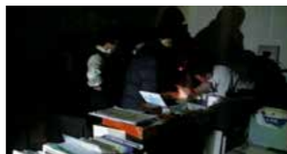
停電の中、書類審査を行う本牧埠頭出張所職員

被災地から離れた横浜税関本牧埠頭出張所は、災害当日、出張所周辺一帯の停電により NACCS が停止し、夜間まで懐中電灯の明かりを頼りに手作業で通関処理を行いました。 また、震災による施設点検のため、成田空港や羽田空港の滑走路が一時閉鎖されたことで別の空港に着陸した国際便への対応や海外から到着した救援物資の迅速通関など、国難を乗り越えるために税関としてできることは積極的に取り組みました。