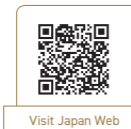
Visit Japan Web