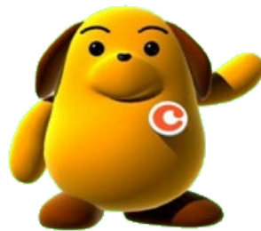
税関イメージキャラクター 『カスタム君』