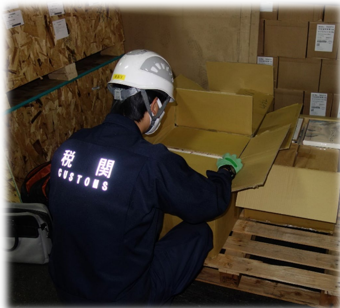
輸入貨物・国際郵便物検査