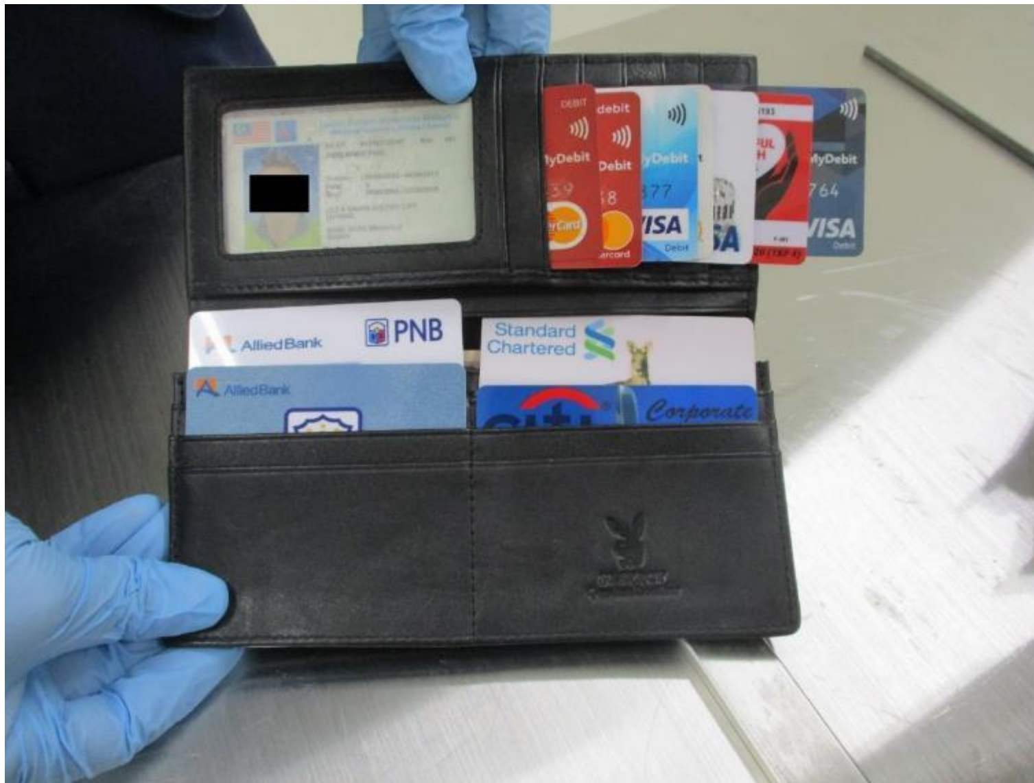
※ 携行するポシェット内財布に隠匿されていた偽造クレジットカード

マレーシア来航空旅客の携帯品から偽造クレジットカード10枚を摘発 (令和2年3月11日 摘発)