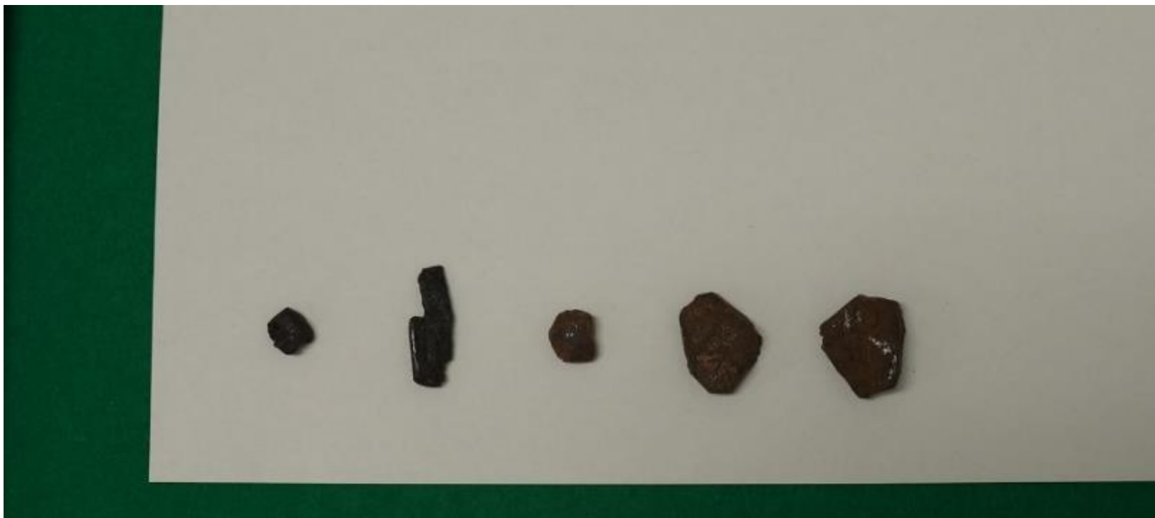
※大麻を並べて拡大したところ