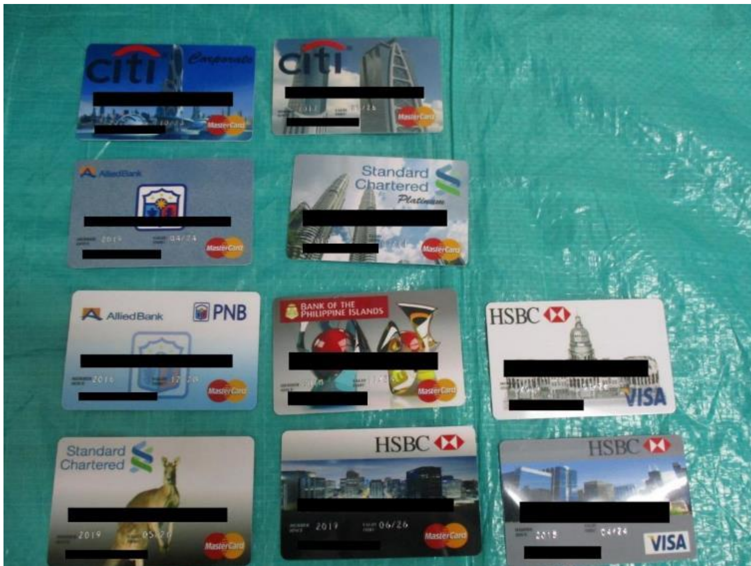
※偽造クレジットカード10枚