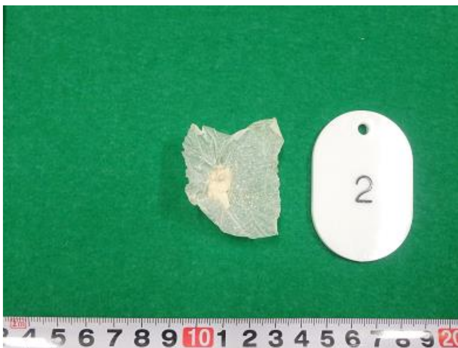
※眼鏡ケース内隠匿(MDMA)