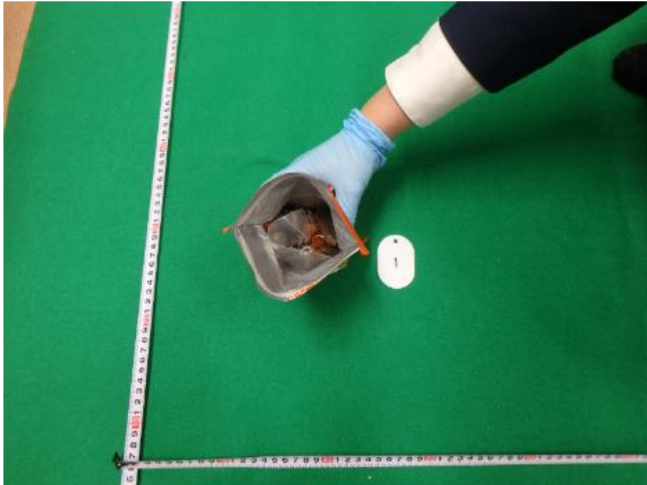
※携帯品内のチョコレート菓子袋内に隠匿 (大麻)

香港来航空旅客の携帯品から大麻5.64g、MDMA0.337g、ケタミン0.063gを摘発 (令和2年2月1日摘発)