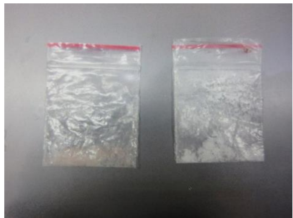
※財布内隠匿(左:MDMA、右:ケタミン)